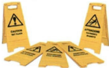
Pannello Avviso: " Pavimento bagnato "