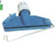
PINZA PER MOP IN NYLON CON GANCI IN ACCIAIO INOX