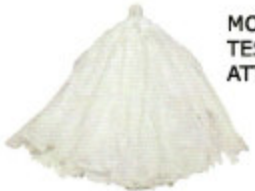
MOP TESSUTO NON TESSUTO ATTACCO A VITE