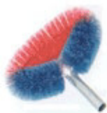
Scovolo ragnatele rotondo