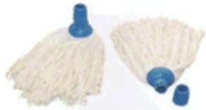
MOP CASA IN COTONE ATTACCO UNIVERSALE A GHIERA